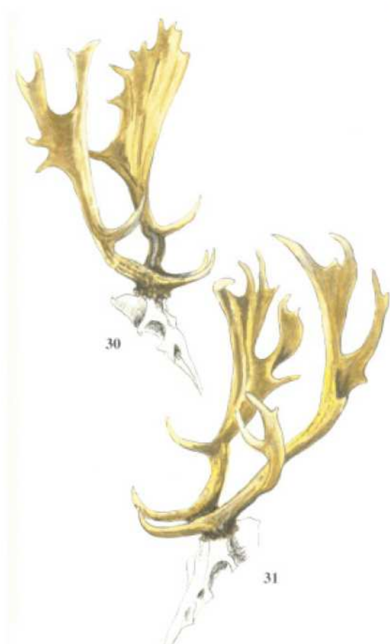
5 bis 6jährige Hirsche